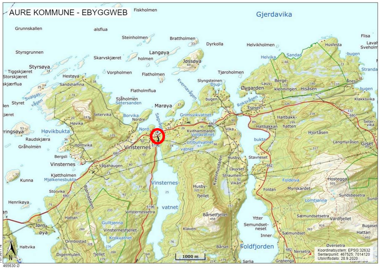
Figur 1: Oversiktskart. Sagvågen markert med rød sirkel.